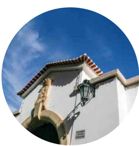
Mercado Municipal de Silves